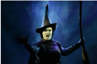
Narrenmutti nach dem Besuch bei den Hexen von Oz

Während die Ratsherren ihren Ausflug für Kunst und Kultur nutzten, besuchten unsere Ratsfrauen Stuttgart und nahmen an einer Fortbildung bei den „Hexen von Oz“ in Stuttgart teil.